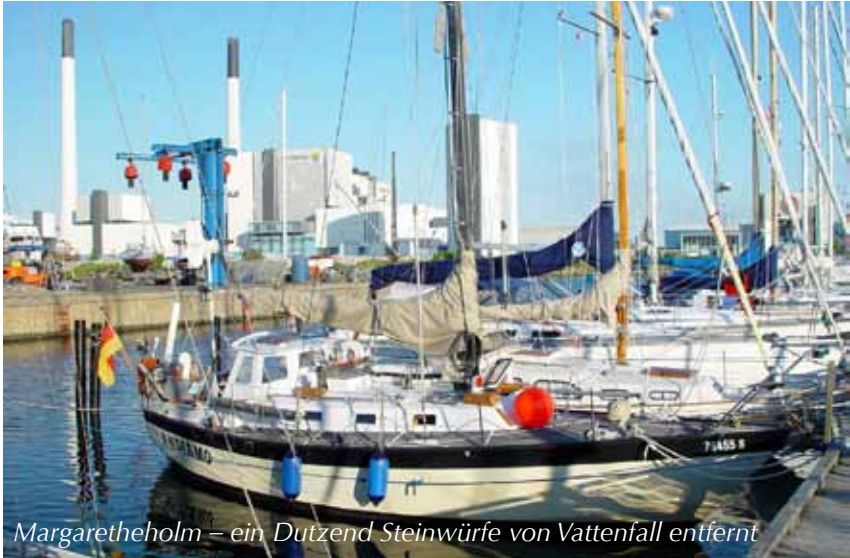
Margaretheholm – ein Dutzend Steinwürfe von Vattenfall entfernt

ten wir zielstrebig und in handlichen Etappen unser Reiseziel København. Diese wundervolle Stadt war seit unserem letzten Besuch vor acht Jahren noch um einiges schöner geworden. Ihre Stadtväter hatten ihr ein Königliches Schauspielhaus und gegenüber auf dem Holmen ein Opernhaus spendiert, hatten die Königliche Bibliothek um einen repräsentativen Anbau erweitert – alles in der den Dänen eigenen und bezwingenden Bauästhetik. Das Opernhaus wurde genau in der Sichtachse Frederikskirken – Amalienborg errichtet. Die dänische Opposition nennt dies die Achse des Bösen: Kirche – Krone – Kapital. Möge dem Kapital niemals Böseres in den Sinn kommen, als Opernhäuser zu bauen! Nahebei, auf dem vom Militär weitgehend geräumten Holmen, richteten sich die Reichen und Schönen indessen ihre artgerechten Wohnsitze ein.