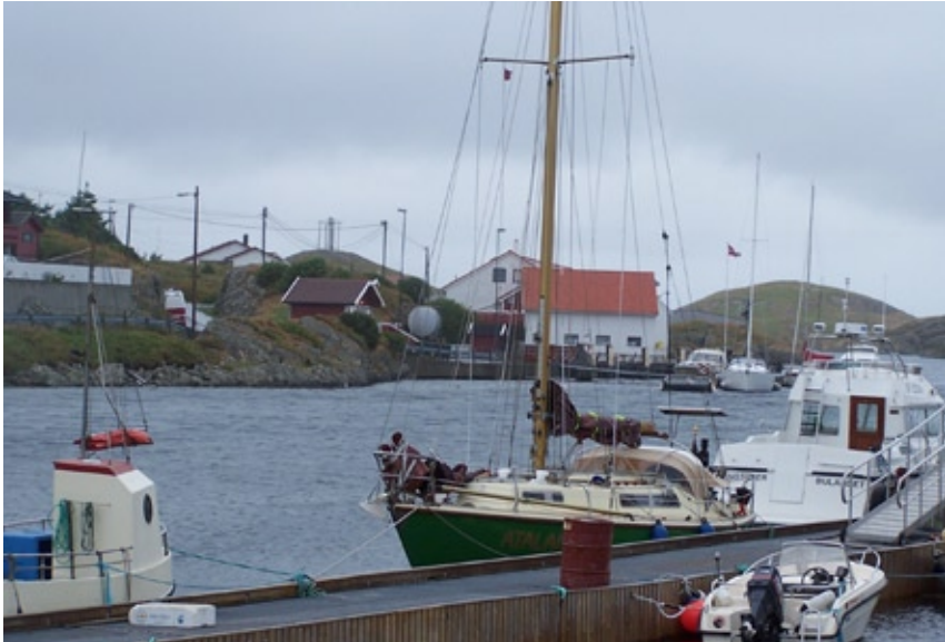
ATALANTE in Buelandet, Norwegen

Utsira und Svinöy ... sind Namen, die eigentlich jeder aus dem Wetterbericht kennt. Sicherlich nicht mehr alle wissen, dass es sich hierbei um Inseln vor der west-norwegischen Küste handelt – die eine noch etwas nördlicher und einsamer als die andere. Damit ist schon gesagt, wo wir uns mit unserer ATALANTE in diesem „Sommer“ herumgetrieben haben.